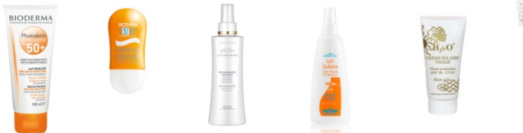
1. BIODERMA 2. BIOTHERM 3. ESTHEDERM 4. DERMACTIVE 5. H2biO 6. AVENE

(1) Parfaitement adapté pour les peaux particulièrement photosensibles à la suite d'un traitement médicamenteux ou interdites de soleil. Photoderm Sensitive Lait Bouclier Très Haute Protection 50 +, Bioderma, tube 100ml, prix indicatif : 11,80€.(2) De texture légère, non grasse et en format nomade très pratique. Fluide peaux réactives multi-protection UVA/UVB SPF50 Sun Sensitive, Biotherm, 30ml, prix indicatif : 26,60€.(3) Une formule sans parfum et riche en actifs désensibilisants et en écrans lumineux pour minimiser les risques de réactions cutanées. Spray Corps Intolérances Solaires, Esthederm, spray 150ml, prix indicatif : 49€(4) Sans paraben, ni phenoxyethanol, ni parfum mais enrichi en glycérine, beurre de karité, vitamines E et A pour une bonne hydratation et une protection anti-radicaux libres. Lait Solaire SPF50+ Dermactive, Laboratoire Sogiphar, flacon-pompe 200ml, prix indicatif : 13,50€.(5) Protection spéciale visage bio à base d'écrans minéraux et d'un filtre naturel végétal (huile de Karanja). Crème solaire visage Haute Protection SPF30, H2biO, tube 30ml, prix indicatif : 17,90€.(6) Dotée écrans 100% minéraux ultra fins pour diminuer les traces blanches et enrichie